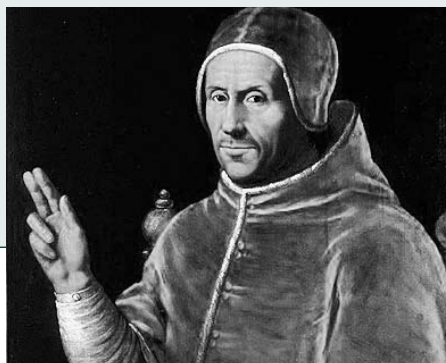
Paus Adrianus VI

De kosten verbonden aan dit symposium bedragen € 10.00 per persoon; alle consumpties zijn daarbij inbegrepen.