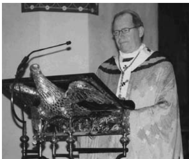
Aartsbisschop Eijk die de aanzet tot het symposium gaf

Aartsbisschop Eijk was toen van mening dat er ook nog iets moest worden georganiseerd waarbij de nadruk meer lag op de persoon van Paus Adrianus zelf en op de devotie voor de Eucharistie, waardoor zijn leven werd getekend. Ook mocht het Katholieke leven in zijn dagen wel iets positiever worden belicht, aldus de aartsbisschop. Hij vroeg of het CRK niet iets kon doen. Nu is het hoofddoel van het CRK het bevorderen van contact niet alleen tussen de gelovigen onderling